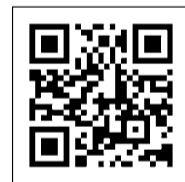
▲おとなとこどものワクチンサイト https://www.vaccine4all.jp/

ワクチンに関する詳しい情報は「おとなとこどものワクチンサイト」(QRコードを読み取るとリンクが開きます)もご参照ください。