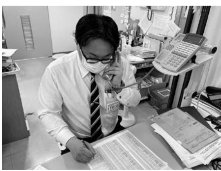
▲ご利用&ご紹介をお願いします