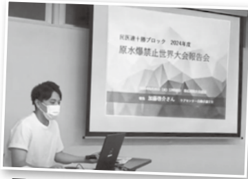
民医連十勝ブロック (8/20)