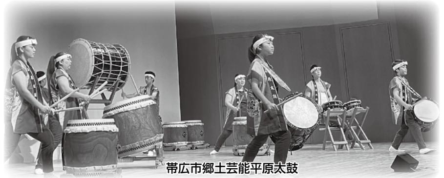
帯広市郷土芸能平原太鼓