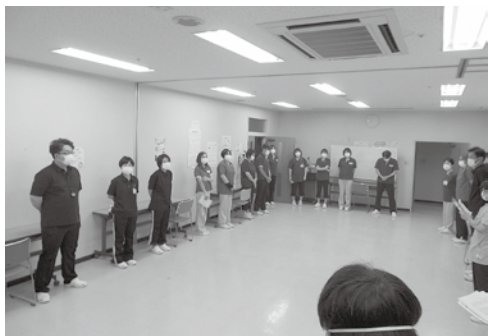
ケアセンター白樺スタート集会

「儲けのタネ」として企業の利益につなげるための「改革」です。国・自治体が保有する個人情報、企業が保有する顧客情報とは比べ物にならない多岐にわたる膨大な情報量です。個人情報が悪用されてもその不利益から国民を守る責務を国は放棄しています(マイナポータル利用規約26条「免責事項」で「デジタル庁(国)は責任を負わない」とされています。社会保障費抑制については、