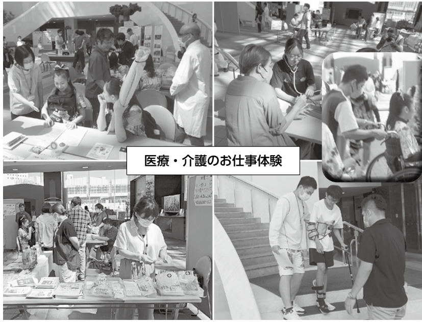
医療・介護のお仕事体験

9月8日(日)、十勝プラザ(帯広市西4条南13の1)にて、2024十勝勤医協健康フェスタを開催しました。参加者は予想を越える約600名となりました。メイン会場ではオープニングの