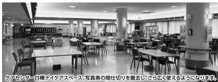
ケアセンター白樺デイケアスペース。写真奥の間仕切りを撤去し、さら広く使えるようになります。

老人保健施設ケアセンター白樺で安心のリハビリと介護ケアを提供し1日しっかりと生活の自立を支えます。