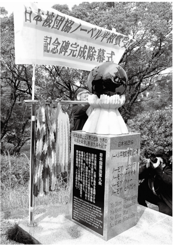
長崎平和公園の九条の碑

ガザ・ウクライナ・イラン：では子どもたち・老人はじめ国民が連日殺されているのだ！街は、故郷は、ガレキの山、廃墟となっている。これでは憎悪怨嗟の連鎖しか生まれない！こういう時だからこそ、いまこそ我が国は、憲法九条に基づく政治と外交をしなければなりません！戦後、世界各地で戦争が起